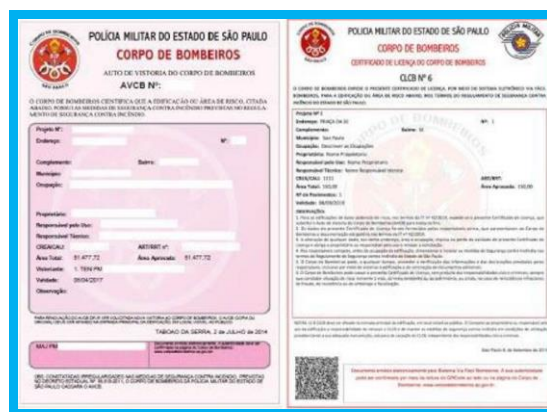
Figura 5 – Modelo de AVCB.

Providenciar junto ao grupamento de Corpo de Bombeiro os documentos que comprovem a segurança do imóvel contra incêndios após aprovação de projeto e vistoria realizada pelo Corpo de Bombeiros.