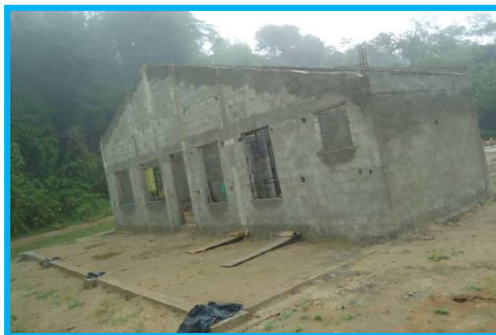
Figura 2 – Fachada da Base de Proteção.