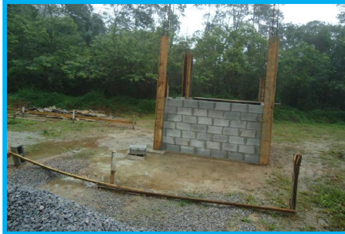
Figura 3 – Local de implantação da casa das baterias, estação de tratamento de esgoto e Caixa d'água.