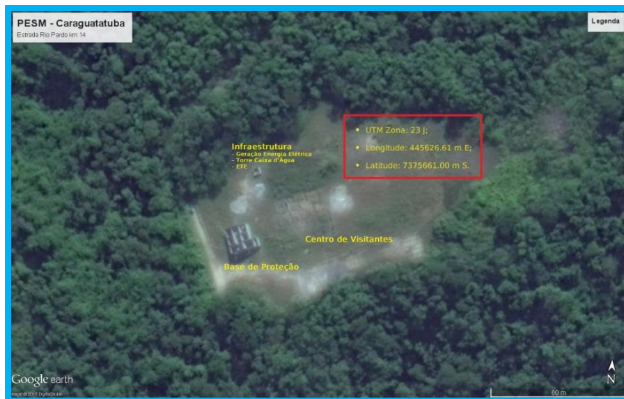
Figura 1 – Local das obras iniciadas, via satélite.