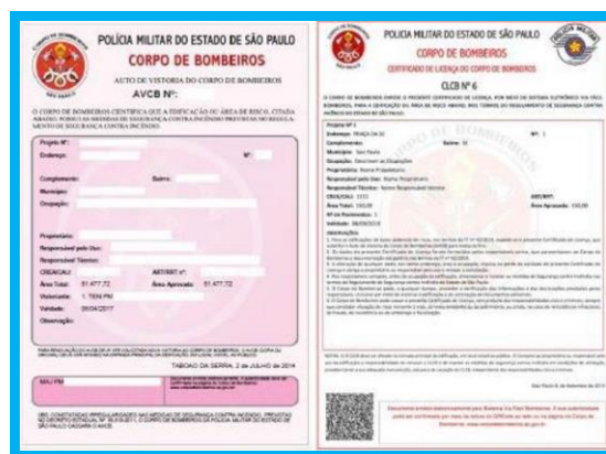
Figura 5 – Modelo de AVCB.

Providenciar junto ao grupamento de Corpo de Bombeiro os documentos que comprovem a segurança do imóvel contra incêndios após aprovação de projeto e vistoria realizada pelo Corpo de Bombeiros.