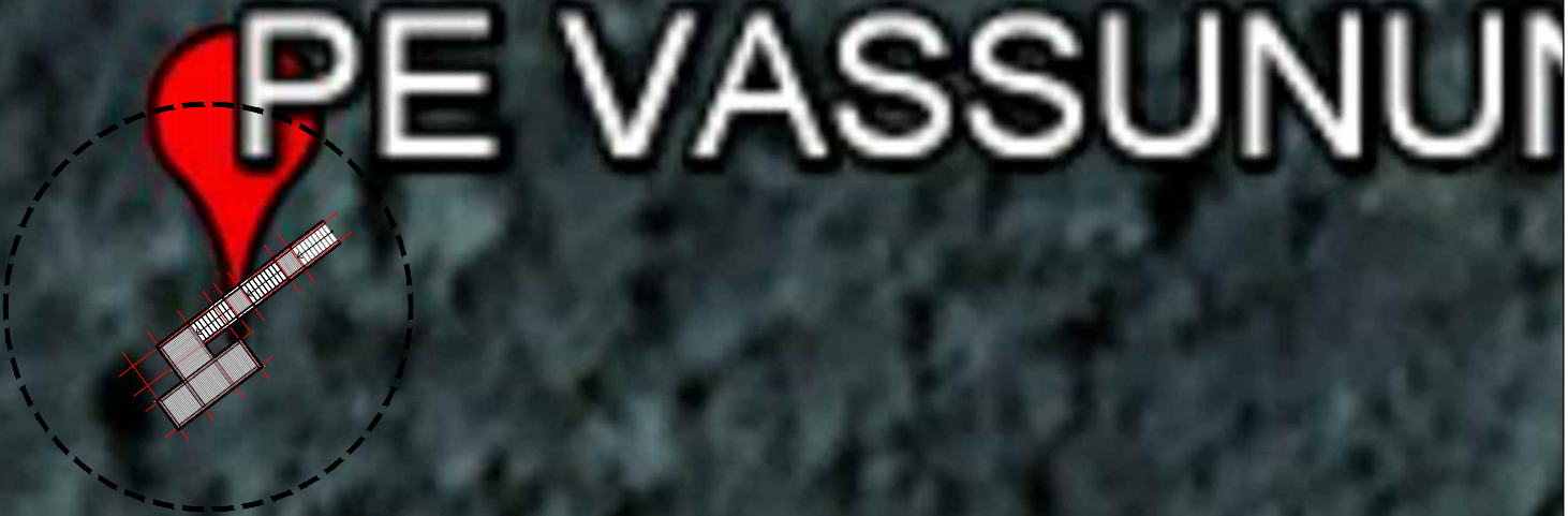
Área de Escape para Implantação